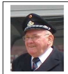
Der neue Vorstand von 2006 bis 2014

Viele neue Feuerwehruheständler sind inzwischen dazu gekommen, wie hier auf dem Gruppenfoto vom März 2006 zu sehen ist.