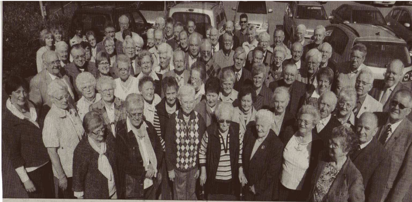
Und die Frauen sind immer dabei: Zu den Veranstaltungen der Ehrenabteilungen sind die Ehepartner stets eingeladen.